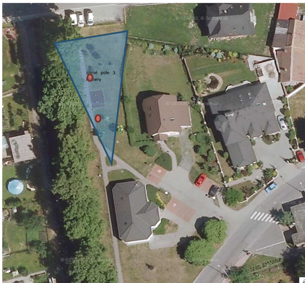
prostor za lékárnou a sousedící hřiště 1