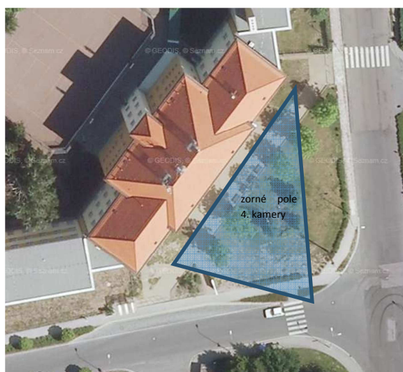
Prostor u ZŠ ve Svítkově 1