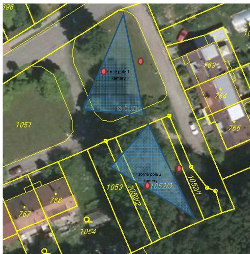
hřiště K Rybníčku