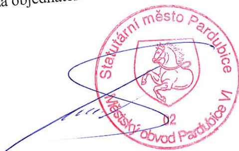
Petr Králíček starosta MO Pardubice VI