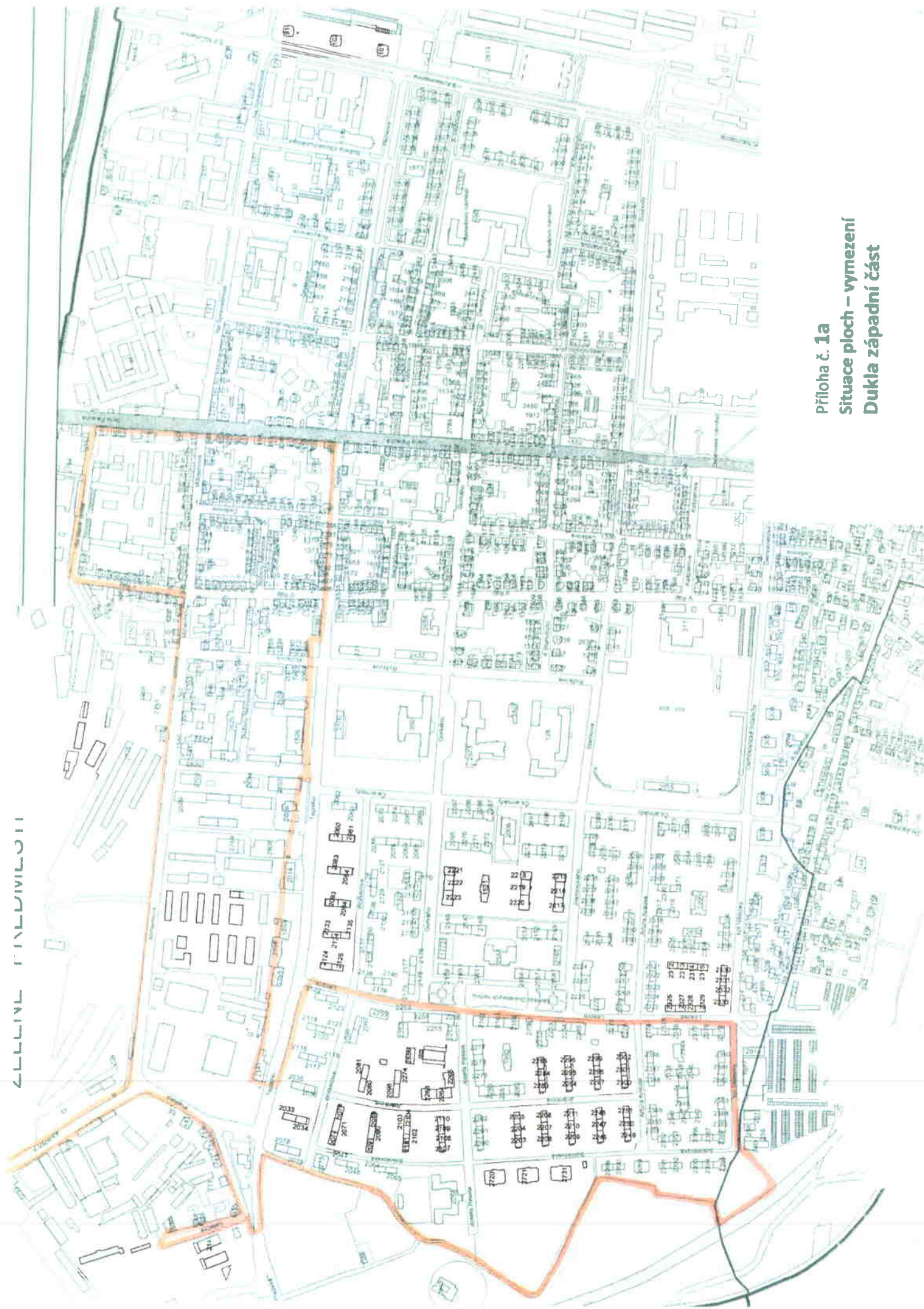
Příloha č. 1a Situace ploch – vymezení Dukla západní část