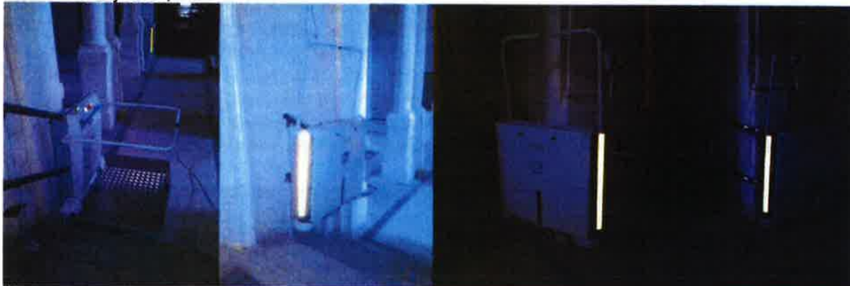
Švihov, Vodní hrad