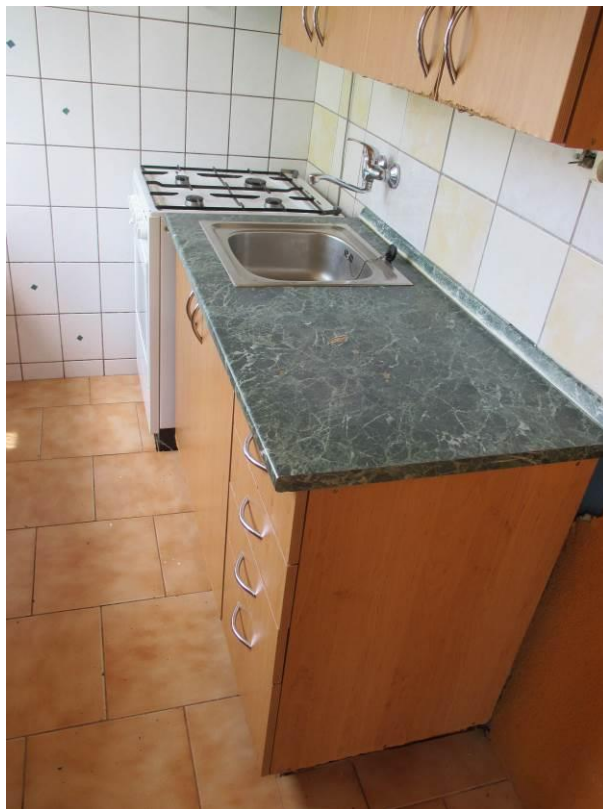
Kuchyň, vpravo kuchyňská linka a sporák.