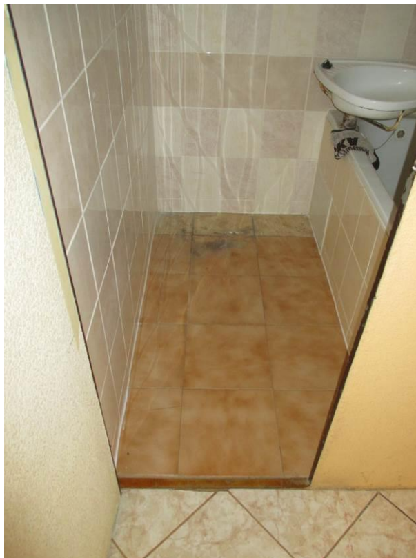
Pohled z předsíně do koupelny.