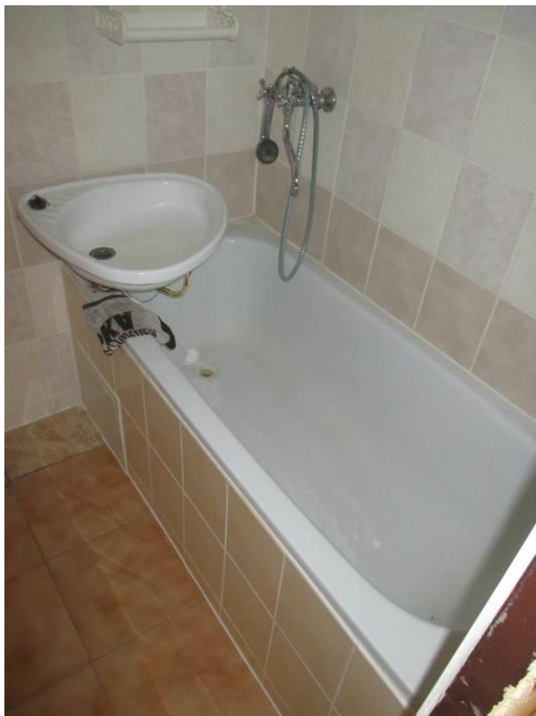
Pohled do koupelny, vana a umyvadlo.