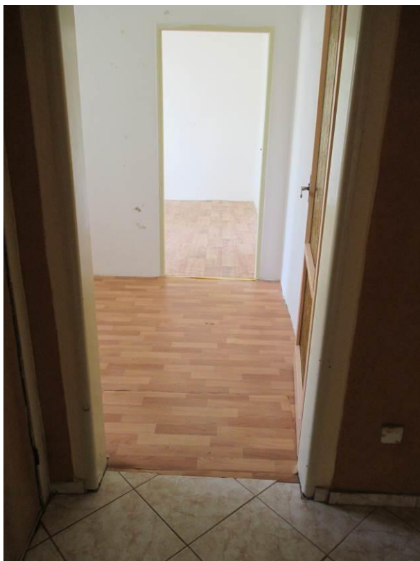
Pohled z předsíně do pokoje.