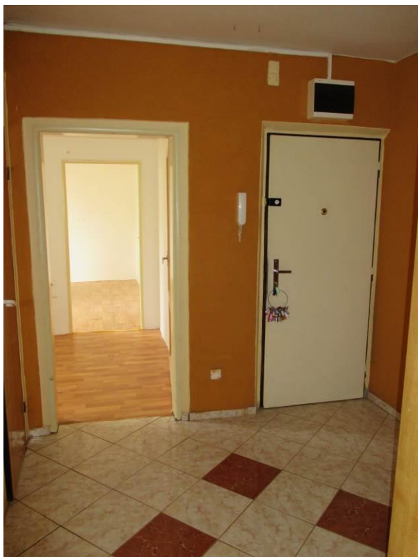
Předsíň, vstupní dveře.