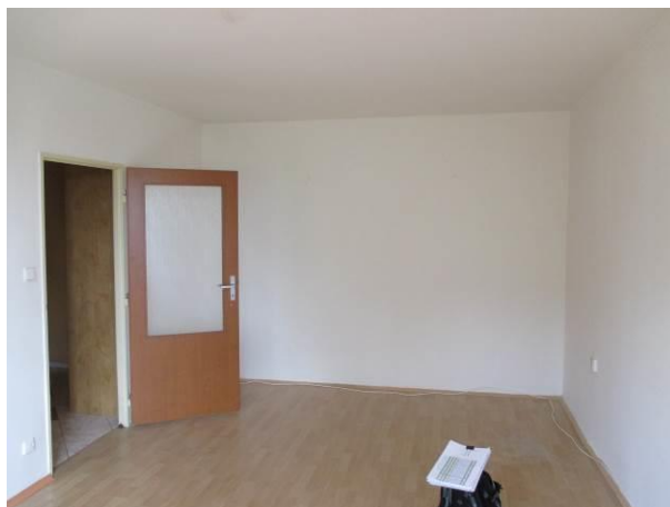
Obývací pokoj, pohled od okna.