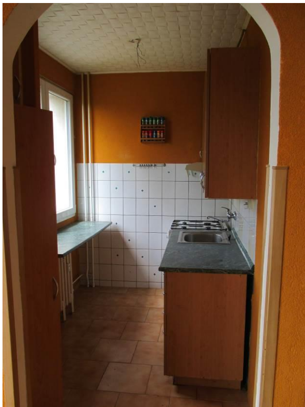
Pohled z obývacího pokoje do kuchyně.