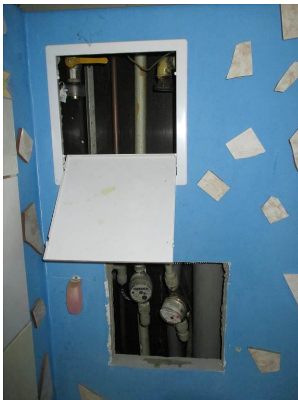
Pohled do instalační šachty za klozetem.