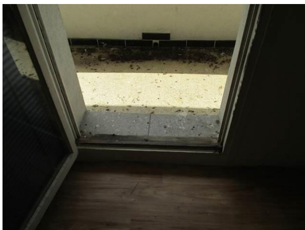
Pohled z ložnice do lodžie.