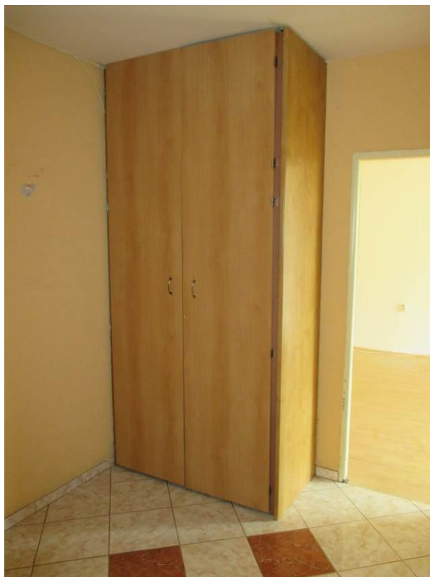
Satní skříň v předsíni.