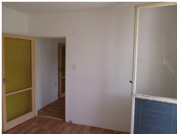
Ložnice, pohled od okna.