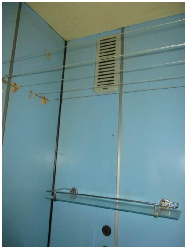
Pohled do koupelny, vana a umyvadlo.