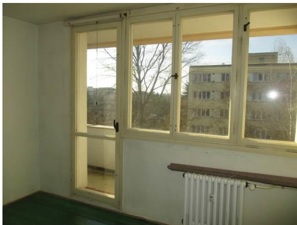
Pohled z ložnice do lodžie.