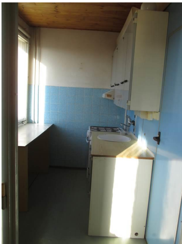
Pohled z obývacího pokoje do kuchyně.