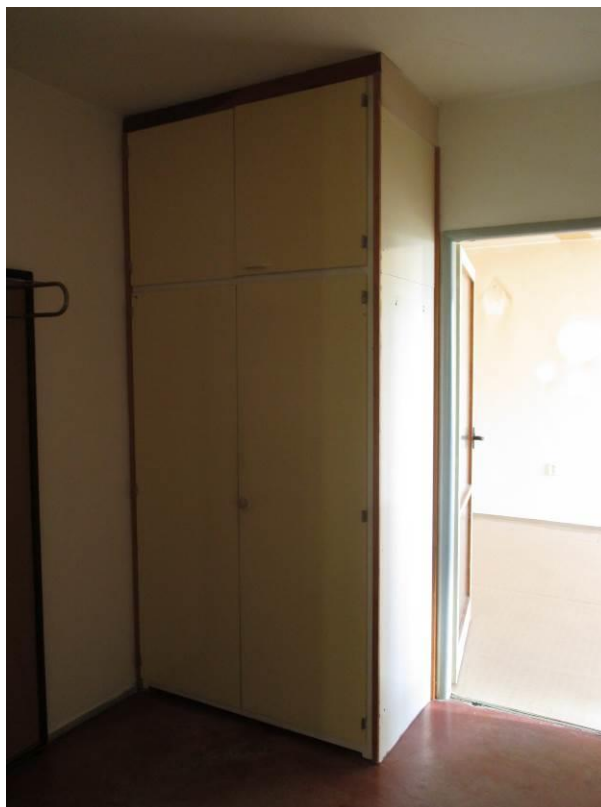
Satní skříň v předsíni.