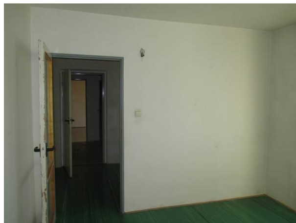
Ložnice, pohled od okna.