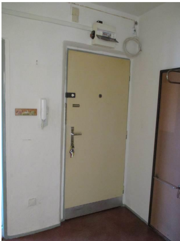
Předsíň, vchodové dveře.