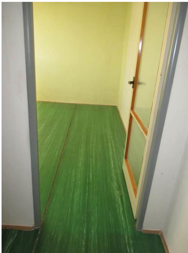
Pohled z pokoje do ložnice.