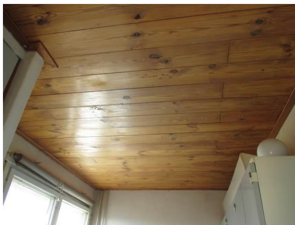
Podhled v kuchyni.