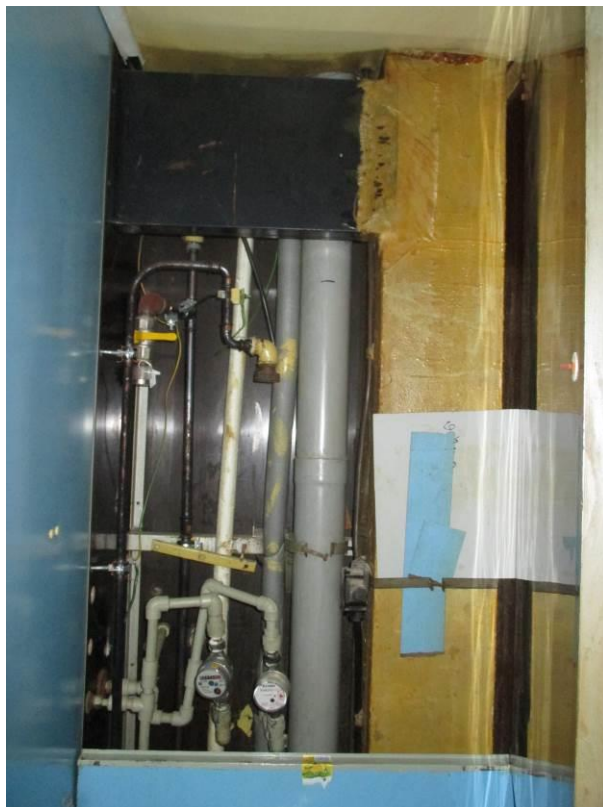
Pohled do instalační šachty za klozetem.