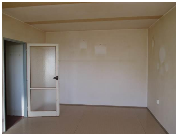
Obývací pokoj, pohled od okna.