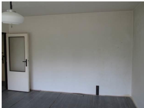
Obytný prostor, pohled od okna.