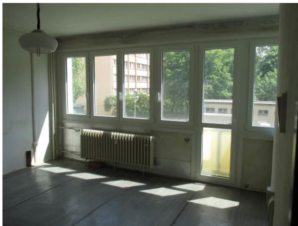
Pohled z před síně do obytného prostoru.