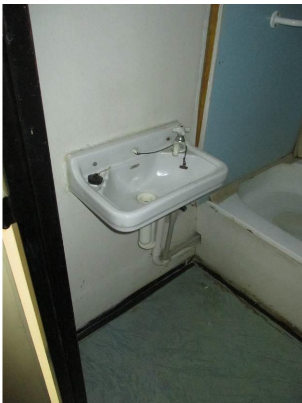
Umyvadlo v koupelně.