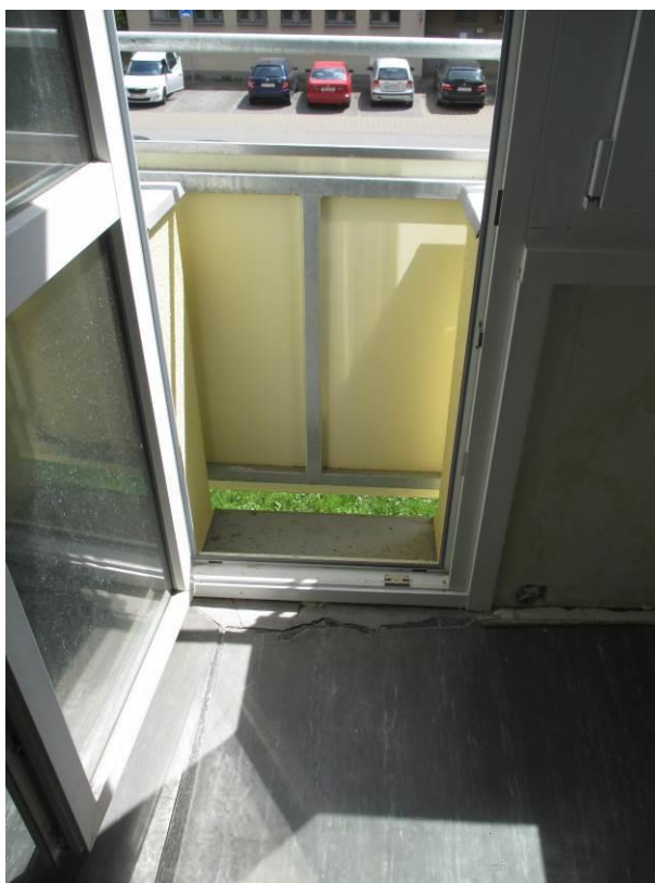
Balkónové dveře v obytném prostoru.