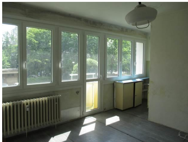
Pohled z obytného prostoru směrem ke kuchyňskému koutu.