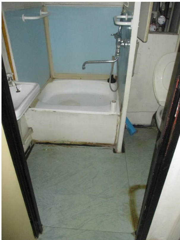
Pohled z předsíně do koupelny, vzadu sprchová vana.