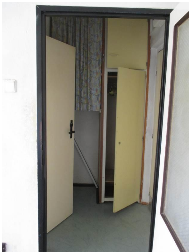
Pohled z obytného prostoru do předsíně, vzadu vestavěná skříň.