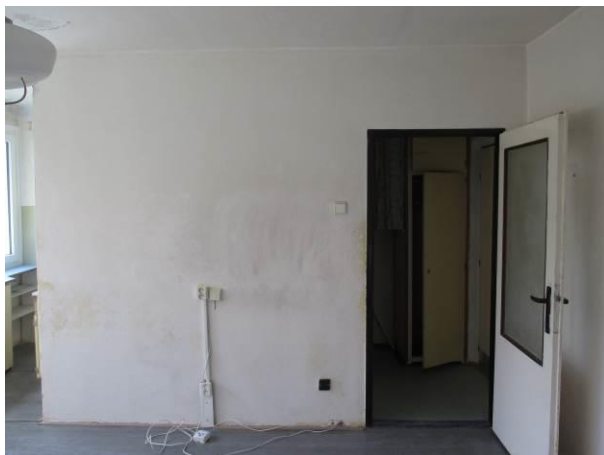
Pohled z obytného prostoru na dělicí příčku, vlevo dole značné poškození vlhkostí.