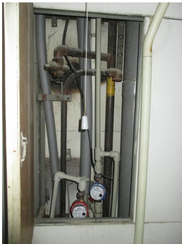
Prostor za WC, pohled do instalační šachty.