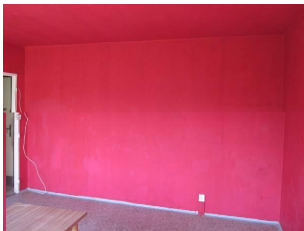
Obytný prostor, pohled od okna.