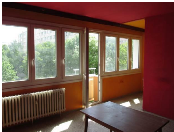
Pohled z obytného prostoru směrem ke kuchyňskému koutu.