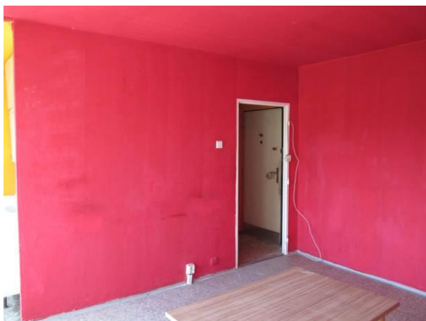
Pohled z obytného prostoru na dělicí příčku.