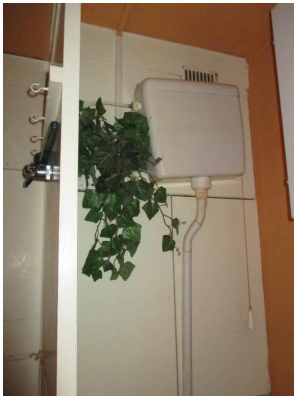
Prostor za WC, pohled na instalační šachtu.