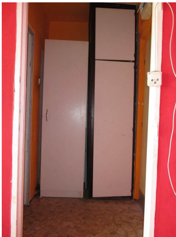
Pohled z obytného prostoru do předsíně, vzadu vestavěná skříň a šatní skříň.