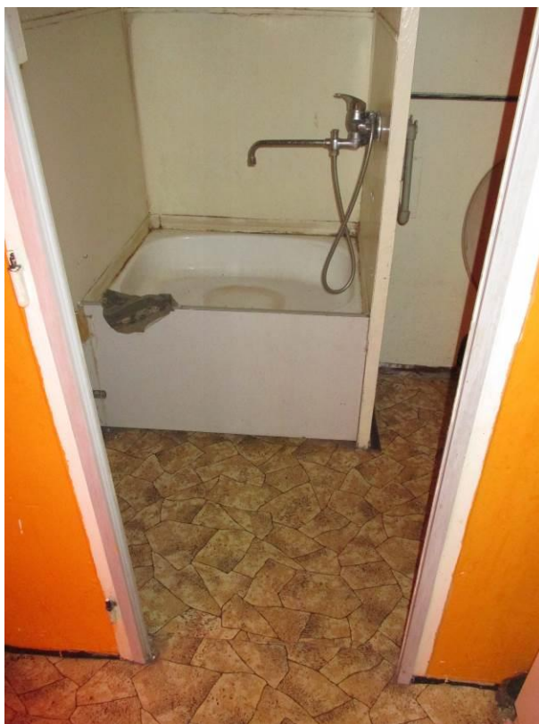
Pohled z předsíně do koupelny, vzadu sprchová vana.