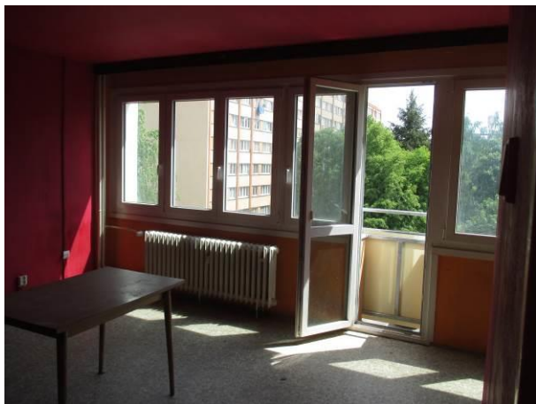
Pohled z předsíně do obytného prostoru.