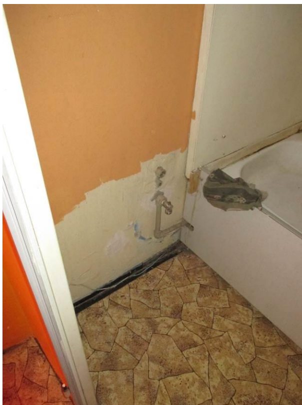
Příprava pro umyvadlo v koupelně.